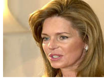
الملكة نور الحسين

عمان- أكدت الملكة نور أرملة العاهل الاردني الراحل الملك حسين بن طلال الاثنين ان مؤسسة الملك الحسين التي تترأسها تعمل جاهدة للحد من الجرائم التي ترتكب في المملكة ضد النساء بداعي الدفاع عن شرف العائلة.