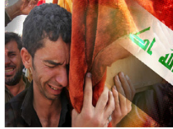
ارتفاع معدل الضحايا 80% مقارنة بضحايا شهر يناير الماضي

بغداد - أعلنت مصادر في وزارات الداخلية والدفاع والصحة في العراق الاثنين مقتل 352 عراقيا بينهم 211 مدنيا في أعمال وقعت خلال شباط/ فبراير الماضي. وكشفت الحصيلة أن بين القتلى 211 مدنيا و45 جنديا و96 شرطيا.