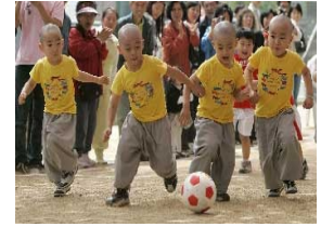
احتفالات ميلاد بوذا

◀ د. عمر الكبيسي قندهار ليست الفلوجة.. عندما يعترف الامريكيون بكارثتهم