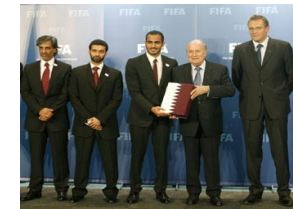
قطر تحمل الحلم العربي وتطرق الباب لاستضافة المونديا ل

وقال عطا أن الاستراتيجية الجديدة للقاعدة هي تغيير المسميات والاعتماد على الارهابيين من القادة العرب أكثر من ضعاف النفوس الذين ارتموا في احضانهم.