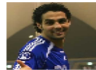
القاص السعودي ياسر الفخاطني من فريق العقربية الى العالمية