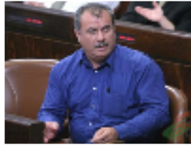
النائب العربي في الكنيست محمد بركة

القدس المحتلة - اعتبر نائبان عربيان في الكنيست الإسرائيلي الخميس أن مشروع رئيس الوزراء بنيامين نتنياهو تعديل قانون الجنسية لجهة أن يصبح قسم الولاء لـ (إسرائيل، دولة يهودية وديمقراطية) هو تعديل عنصري. وقال النائب محمد بركة إن نتنياهو قرر افتتاح الدورة البرلمانية الشتوية بوابل جديد من القوانين العنصرية التي تتناغم مع أفكاره الشخصية، وأفكار حكومته، بالمصادقة على تعديل جديد لقانون المواطنة العنصري.