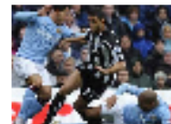
ظاهرة اللعب العنيف تطل برأسها في إنكلترا مزيد