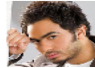
اتهام تامر حسني بـ"ركوب الموجهة" بالفناء لشهداء تونس وتجاهل المصريين الذين قتلوا بيد شرطة بلاذهم