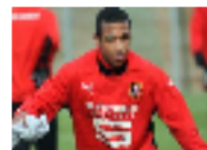
براهيمي يرفض اللعب للجزائر