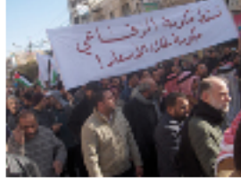
مسيرة سابقة تدعو إلى سقوط حكومة الرفاعي

عمان - شهدت عدد من المدن الاردنية بعد صلاة ظهر الجمعة مسيرات شعبية هي الثانية من نوعها للمطالبة برحيل الحكومة وإجراء اصلاحات سياسية واقتصادية. وانطلقت في العاصمة عمان مسيرة من أمام الجامع الحسيني وسط المدينة شارك بها مئات المواطنين تقدمتها قادة أحزاب المعارضة لاسيما الإسلاميون إضافة لل نقابات المهنية.