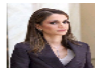
الأردن: شريط فيديو لمعلمة تعذب تلميذاً بنبر إشمئزاز الملكة وقلق وزارة التربية