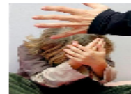
زوج أسترالي قد يواجه اتهامات باغتصاب زوجته قبل نصف قرن