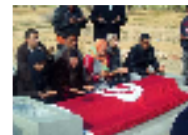
أسرة البوعزيزي تتحدث عن مأساتها... والدته تطلب من الله ان يرسل كل أسرة بن علي والطرابلسي