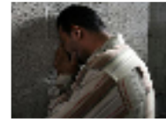
جزائر بريطاني جز حنجره عشيق زوجته