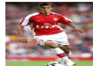
المدير الفني للمنتخب المغربي فلق علي مستقبل الشماخ مع أرسنال