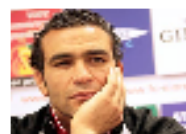
محكمة سويسرية تجبر حارس المنتخب المصري الحضري ونادي سيون على دفع 800 ألف دولار