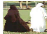
سعودي يطلق زوجته لأنها تريد محرمًا في كل سفر لها