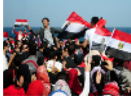
مصريون يحتفلون بنجاح الثورة الشعبية في شمال ميناء الإسكندرية

القاهرة- أعلم ناشطون أقباط الثلاثاء اعتراضهم على تشكيلة لجنة تعديل الدستور التي أعلن الجيش تعيينها لتضمثها ممثلين للاخوان المسلمين من دون أن يكون فيها تمثيل قبطي.