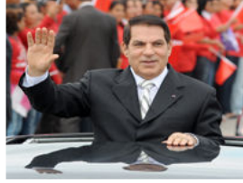
الرئيس التونسي المخلوع زين العابدين بن علي

دبي- تونس- أعلن أحد المقربين من عائلة الرئيس التونسي المخلوع زين العابدين بن علي (71 عاما) ومصدر آخر سعودي، أن بن علي الذي فر من البلاد في 14 كانون الثاني/يناير تحت ضغط الشارع دخل "في غيبوبة" منذ يومين في مستشفى في جدة في السعودية اثر جلطة دماغية.