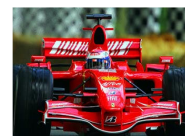
اضطرابات البحرين تزيد المخاوف من إلغاء سباق فورمولا 1