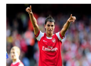
الشماع منهك في ارسنال لكنه سيعود لتألقه أمام حبه الحاد