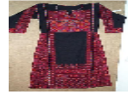
مصمم أزياء شاب يجسد التقاليد الفلسطينية بطريقة حديثة