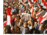
علم مصر أكثر مبيعا من أي وقت مضى وسط الاحتجاجات والاحتفالات مزيد