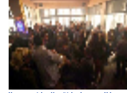
اسلاميون يطالبون بإغلاق الملاهي والمراقص بالأردن ومطالبة شبيكات الدعارة