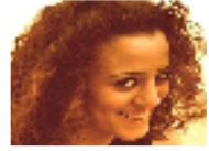
سالي زهران اشهر وجه في الثورة المصرية كانت تعلم بالتغيير واستشهدت من اجل تحرير بلادها