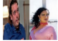
تضارب الانباء حول مكان وجود البن سكاف زوجة هنيعل القذافي الليبانية وعائلتها