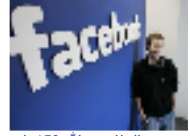
انباء عن عرض الملك عبدالله 150 بليون دولار لشراء موقع فيسبوك والسعودية تنفي