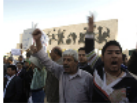
عراقيون يتجمعون في ميدان التحرير بالعاصمة بغداد

بغداد- تحدى آلاف العراقيين حظر التجوال في العاصمة العراقية بغداد ومدن أخرى وخرجوا في تظاهرات (جمعة الكرامة) تكريما لضحايا تظاهرات الجمعة الماضي ومواصلة التعبير عن مطالبهم بالإصلاح والتغيير ومحاربة الفساد والمفسدين وإيجاد حلول جذرية لتردي الخدمات وفرص عمل للعاطلين.