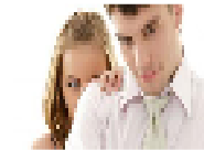
المراهقون والشباب الأمريكيون يمارسون الجنس أقل مما كانوا يفعلون سابقاً