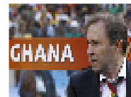
بوادر أزمة بين قطر والسعودية والبيانات تتوالى حول مدرب كرة قدم