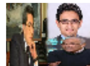
اجور فلكية لمديعي القنوات المصرية ووائل عليم يدافع عن مرتب محمود سعد ويهاجم شفيق