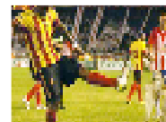
لاعب كرة قدم بنير ضجة بعد ركله لوبمة في أرض الملعب