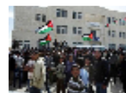
طلاب مدرسة أردنية يطالبون بإسقاط المدير