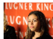
عشيقة برليسيكوني المغربية الاصل تريد