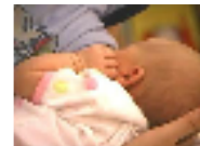
الرجال ينزعجون ويخرجون من إرضاع شريكاتهم لأطفالهن علناً