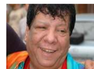
شعبولا: غانتي فجر ثورة يناير في مصر واحتمال ارضح نفسي للرئاسة