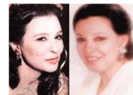
مطالب بفتح ملف مقتل الفنانة سعاد حسني ونجاة تقدم بلاغ للنائب العام