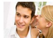
دراسة: صداقة الجنسين مفيدة للفتيان وليس للفتيات