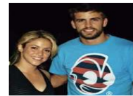
قبة ساخنة على غلاف مجلة كولومبية تؤكد علاقة اللاعب بيكيه بشاكيرا