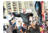
حسام حسني ينفي تأييده لنظام مبارك ويهدد بالرحيل إلى الإمارات