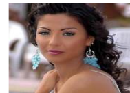
زوج دوللي شاهين: لا يصافيني ارتداؤها المايوه وأرفض ان يقبلها احد في الافلام