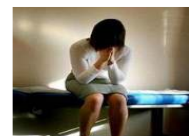
مصرية تقتل زوجها وتحرق جثته بمساعدة عشيقها بعد علمه بملافتهما