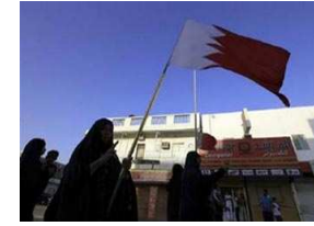
19 مدريا مصريا يغادرون البحرين

شاديرا نعلن ارتباطها بداعب برشلويه بيديه