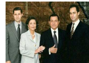
تأثير سوزان مبارك ونجليها على الرئيس، فى

حابوا سيعفون بحس هذه الاموال وهم يحمون مصر ويعيسون في احس تصورهما . الاجابة هي الجشع، وقصر النظر، وانعدام الحس الوطني، والاحساس بألاف الفقراء والمحرومين بالتالي.