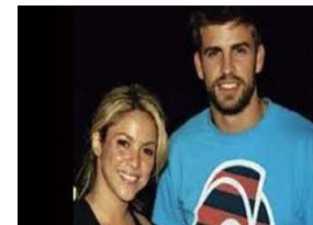
شكركم على كل ما تقدموننا به من أخبارنا