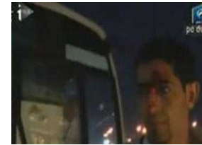
اتهامات لسفير زاهر بتدبير الاعتداء على حافلة منتخب الجزائر بالقاهرة 2009