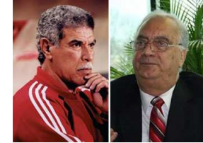
جماهير المنتخب المصري تطالب برحيل سمير زاهر وحسن شحاتة