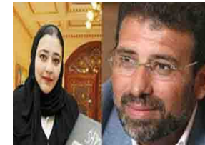
خالد يوسف يحتفل بزفافه على الفنانة التشكيلية السعودية شاليمار شربتلي في جدة