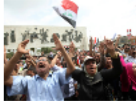
عراقيون يتظاهرون في ساحة التحرير ببغداد

بغداد- تظاهر حوالي ألفي شخص بعد صلاة الجمعة في الاعظمية في بغداد مطالبين برحيل القوات الأمريكية تزامنا مع ذكرى سقوط نظام الرئيس الراحل صدام حسين في التاسع من نيسان/ ابريل 2003. وتجمع المتظاهرون بعد الصلاة أمام مسجد الإمام أبي حنيفة النعمان، في منطقة الاعظمية معقل العرب السنة في شمال بغداد للمطالبة برحيل القوات الامريكية ورفض الاحتلال.