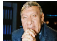
لكمة في وجه الاعلامي المصري مفيد فوزي بسبب محاكمة مبارك