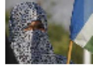
متشددون يدعون لشن هجمات على فرنسا بعد حظر النقاب