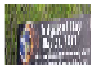
دبي تزيل لوحات تروج لنهاية العالم الشهر المقبل