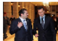
هل يبلغ التوتر بين سورية وتيار المستقبل حد اتهام الحريري بالتخطيط لانقلاب؟