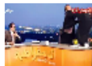
تبادل اللكمات على الهواء بين ضيفي بقناة عراقية بعد إهانة أحدهما لصادم حسين