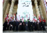
هل يحل اختبار الـ DNA مأساة مفقودي الحرب الأهلية في لبنان؟