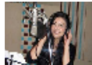
مطربة سورية تطلق أغنية "أفرحي يا مصر بولادك" تحية لشباب الثورة