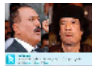
القذافي يحصد أعلى الأصوات في مسابقة "من سيفتل المليون" بتويتر ويتفوق على صالح والاسد