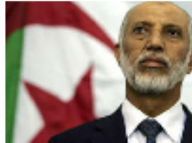
وزير الدولة الجزائري عبد العزيز بلخادم

الجزائر- يو بي اي: ربط وزير الدولة الجزائري عبد العزيز بلخادم الممثل الشخصي للرئيس عبد العزيز بوتفليقة عودة العمليات المسلحة التي نفذتها الجماعات المسلحة في الأيام الأخيرة وراح ضحيتها نحو 15 عسكريا بالوضع المتأزم في ليبيا جراء انسحاب الجيش الليبي من الحدود مع الجزائر وانكشافها أمام عمليات تهريب الأسلحة. وقال بلخادم في تصريح له الأربعاء إن عدم استقرار الوضع في ليبيا عمقه تنقل الأسلحة إلى وجهات لا يعلمها أحد من دون أن يستبعد أن تكون تلك الأسلحة قد وقعت في يد تنظيم القاعدة في بلاد الجماعة السلفية للدعوة والقتال.