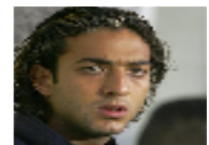
رجل أعمال سعودي يقف نادي الزمالك ويدعم صفقة ميدو