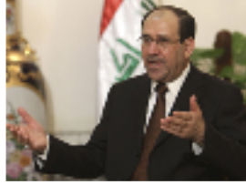
رئيس الوزراء العراقي نوري المالكي

بغداد- ا ف ب: أكد رئيس الوزراء العراقي نوري المالكي الخميس خلال لقائه مع القائد العسكري الأمريكي الأعلى رتبة أن الجيش العراقي قادر على تولي المسؤولية الامنية في البلاد في وقت من المقرر أن تسحب واشنطن قواتها من العراق نهاية العام الجاري. وهذه التصريحات التي وجهها المالكي إلى رئيس هيئة أركان الجيوش الأمريكية الاميرال مايك مولن، كان سبق ان ادلى بها أمام رئيس مجلس النواب الأمريكي جون بوينر خلال زيارة الأخير إلى بغداد قبل أيام.