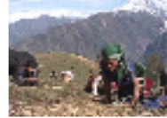
النيابليون يتحدون الجبال العورة بحثا عن دودة مقوية جنسيا