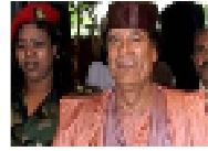
الكتب التي منعها القذافي تلقى رواجاً في مناطق المعارضة الليبية