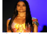
احتجاج هندوسي لرسم الهولوم على مؤخرة عارضة أسترالية