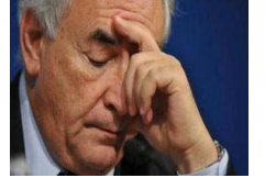
بين النزوة الجنسية والمؤامرة السياسية.. رئيس صندوق النقد الدولي يدفع الثمن