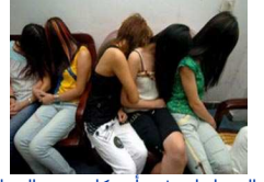
بعض المتعلمات في أمريكا يخترن العمل في مجال الدعارة