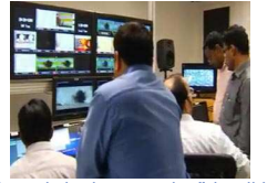
"ليبيا الاحرار" قناة تحتضنها قطر لدعم الثورة