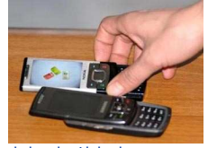
السنح سبيع سنوات لثلاثة اشقاء اردنيين قتلوا شقيقتهم لإملاكها هانفا نقالا