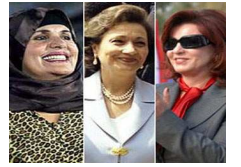
صحيفة امريكية: ثروة زوجة الفدافي تفوق ثروة ليلي طرابلسي 30 مليار دولار