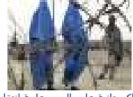
إجبار باكستانية على السير عارية انتقاماً من ابنها