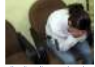
اردني استغل سفر والده الى العمرة وأغتصب شقيقته