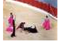
فشل الملوك والفاتيكان في منعها ونجح البرلمان ... كاتالونيا تصح حدا نهائيا للعبة مصارعة التيران