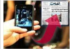
upload your videos or photos