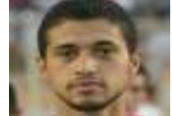
اعتزال لاعب جزائري بسبب "الكلام البذيء والمال الحرام"