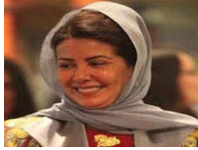
ابنة العاهل السعودي الأميرة عادلة

الرياض - (يو بي اي): كشف ابنة العاهل السعودي الأميرة عادلة بنت عبدالله بن عبدالعزيز أن عددا من المختصين يقومون حاليا بوضع قانون لوضع حد أدنى لسن زواج الفتيات في المملكة رغم وجود العديد من الأصوات المعارضة الذي وصفته بأنه "مخالفة شرعية". ونقلت صحيفة (الرياض) السبت عن الأميرة عادلة أن عددا من الجهات الحقوقية والقضائية تعمل الآن على وضع قانون فاعل وصارم لوضع حد أدنى لسن زواج الفتيات ومن المتوقع أن يصدر قريباً لما سيحققه من مصلحة عامة لكافة المجتمع.