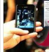
upload your videos or