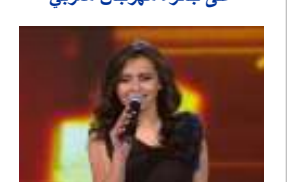
عودة كارمن سليمان نجمة 'أراب أيدول' إلى القاهرة لجمع أصوات المصريين