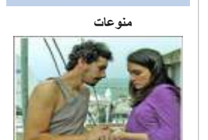
فيلم متهم بالإساءة للجزائريين ينافس على جائزة مهرجان مغربي