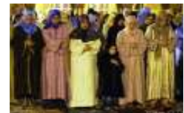
تفوق النساء على الرجال في التدخين بالمغرب يفجر مناوشات إلكترونية بين الجنسين