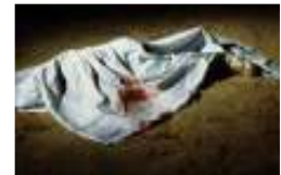
مصرية رفضت الكنيسة تطليقها تقطع زوجها لأشلاء بعد ممارسته الجنس معها