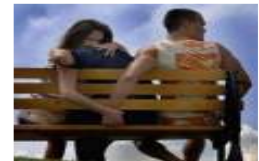
إيطالي يطلب تعويضات من عشيق زوجته