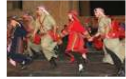
ديكة فساد أردنية أمام السجن بمشاركة شبيلات ومطرب يشتم اللحمه ويقبل الطماطم