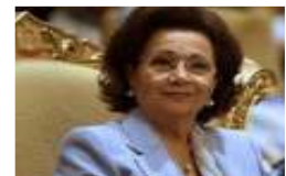
تقارب سهان مبارك تعدد الشقة

أقسام النساء والولادة، وقال ان أكثر من 100 طفل من الخدج 'سيعرضون لأبشع مواجهة مصيرية يندى لها جبين البشرية' عندما تنقطع الكهرباء عن أجهزة الحياة التي يرددون فيها. وأكد على تفاقم الوضع الصحي في أقسام القلب، وفي غرف العناية المركزة، كذلك أكد أن خطر انقطاع الكهرباء يهدد عمل المختبرات وينوك الدم في كافة المستشفيات. وناشدت الصحة أحرار الثورة المصرية والمشير محمد حسين طنطاوي، ومجلس الشعب والأحزاب لاتخاذ 'موقفاً أخلاقياً ووطنياً داعماً لتنفيذ ما تم الاتفاق عليه وإرسال الوقود'. واستمرت التظاهرات التي ينظمها الغزيون أمام الحدود المصرية للاحتجاج على استمرار أزمة الوقود، وخرجت تظاهرة من النساء والأطفال وتجمعت عند منطقة حدودية تفصل عن الأراضي المصرية، رفع خلالها لافتات تطالب المجلس العسكري المصري بتزويد القطاع بالوقود.