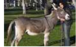
أمريكية تتزوج من حمار بعد قصة حب استمرت عامين