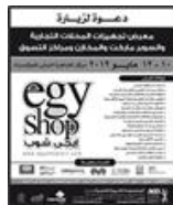
معارض و مؤتمرات