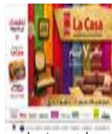
معارض و مؤتمرات