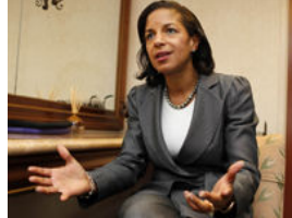
السفيرة الأمريكية في الأمم المتحدة سوزان رايس

بوكا راتون - (رويترز): قالت السفيرة الأمريكية في الأمم المتحدة سوزان رايس إن من السابق لأوانه للغاية إعلان فشل جهود كوفي عنان المبعوث المشترك للامم المتحدة وجامعة الدول العربية في سوريا لانتهاء 14 شهرا من العنف هناك. وتحدثت رايس مع رويترز في فلوريدا بعد ساعات من تفجير سيارتين ملقومتين في دمشق الخميس مما أسفر وفقا لوسائل إعلام رسمية سورية عن مقتل 55 شخصا وإصابة 372. والتفجيران هما أعنف هجوم تعرض له العاصمة السورية منذ اندلاع انتفاضة ضد الرئيس السوري بشار الأسد العام الماضي.