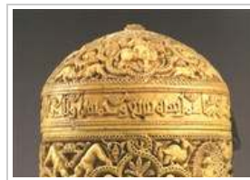
فنون الإسلام في اللوفر السبت ٢٢ سبتمبر ٢٠١٢ 7 صورة