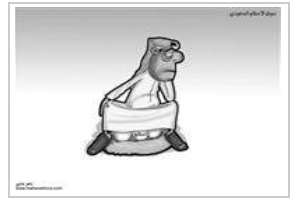
ماهر عاشور السبت ٦ أكتوبر ٢٠١٢