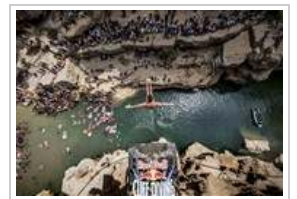
العطس من المرتفعات الإثنين ١ أكتوبر ٢٠١٢ 2 صورة