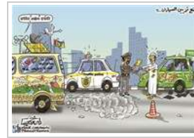
ناصر خميس السبت ٦ أكتوبر ٢٠١٢