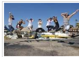
عروض "ريد بل فلاينج باح" الإثنين ٢٤ سبتمبر ٢٠١٢ 5 صورة