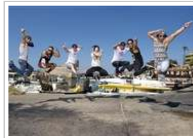
عروض "ريد بل فلانينغ باخ"