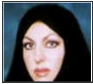
ثريلا لشهري عابرة ياءة - شغفها البيت

إلى داخل أرق لئلا عن مدى رطب على مظهره الخارجي وطواحيه فضلاً عن كرهها وتعاملاً مع لئلا على وجع لخصوص، ومدى عتوق بحقوقهن، ورطب عليها ودفاعاً عنها باعتبار أن ذلك يشكّل بذرة رتياح لها في إيمانها بكامل قوقها نطقاً من ريبها لتعبيرها لرأي.