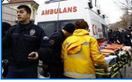
Olay yerinden ilk fotoğraflar