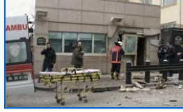
Patlamadan sonraki tüm görüntüler