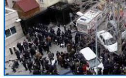
Patlamanın olduğu kapının özelliği

KIRMIZI ŞÖRTLÜ NİŞANCILAR GÖREV BAŞINDA / FOTO GALERİ