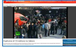
İki şüpheli kameralarda görüntülendi