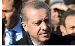
'Canlı bomba paramparça oldu'