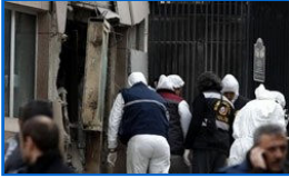
Görgü tanığı patlama anını anlattı