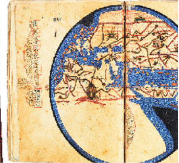
Sergide yer alan 600 yıllık haritalar arasında Abbasi halifesi Memun’a ait dünya haritası da yer alıyor.