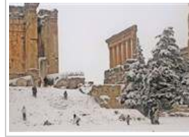
عاصفة ثلجية تضرب البلاد الأربعاء ٩ يناير ٢٠١٣ 12 صورة