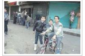
الحياة في حلب الأحد ١٧ فبراير ٢٠١٣ 14 صورة