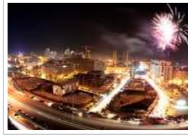
احتفالات رأس السنة الإنئين ٣١ ديسمبر ٢٠١٣ 9 صورة