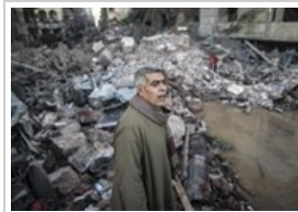
صور لموقع مديرية أمن