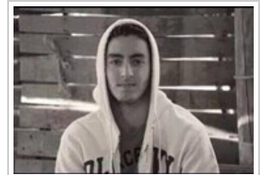
صور تحكي قصة "محمد