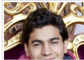
صور التقطها مصوّر سوري