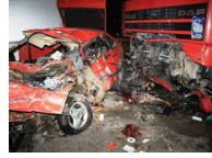
Otomobil TIR'ın altında kaldı: 2 ölü