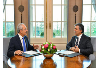
Abdullah Gül Kılıçdaroğlu ile görüştü