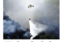
Yılın Basın Fotoğrafları Yarışması'ndan eşsiz fotoğraflar