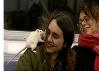
Metroya fare ile biniyor!