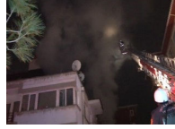
Kadıköy'de yangın faciası: 1 ölü