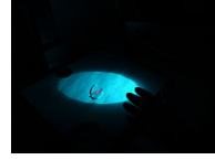
17,5 milyon kişi parmak izlerinden tanınıyor