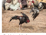
Pakistan'da horoz dövüşü ilgi odağı oluyor