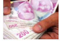
Binlerce lira cebinizde kalsın