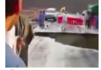
Üzerinde yürüdüğü köprü böyle çöktü