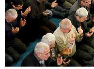
Vatandaşlar camilere akın etti