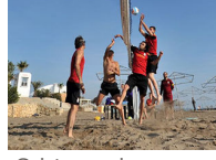
Galatasaraylı futbolcuların voleybol keyfi