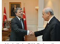
Abdullah Gül Bahçeli ile görüştü