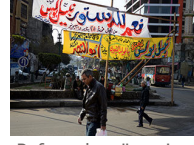
Referandum öncesi Mısır sokaklarına pankartlar asıldı