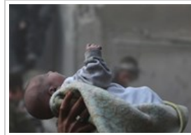
بالصور.. إنتشال رضيع حي