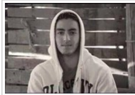
صور تحكي قصة "محمد