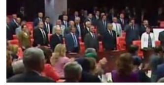
Demirtaş'a sosyal medyada büyük tepki