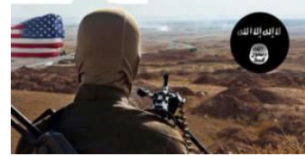
Kara listede Türkiye izi