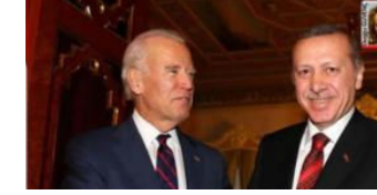
Suriyeliler Kırşehir'de eğitilecek