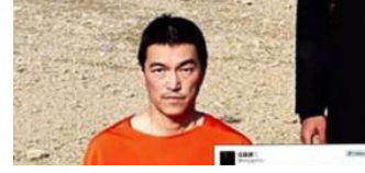
Öldürülen Japon gazetecinin attığı tweet paylaşım rekorları kırıyor