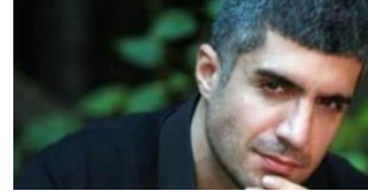
Özcan Deniz'den çok sert Özgecan mesajı