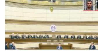
Adalet yere indi