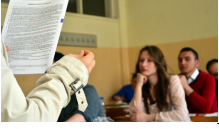
YGS sorularının tamamı adayların erişimine açıldı