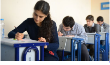
YGS'de kızlar daha başarılı