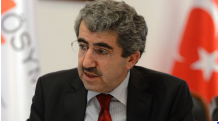
YGS sonrası ÖSYM'den çarpıcı açıklama