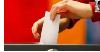
Koalisyonun ayak sesleri