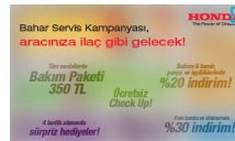
Honda Servis Kampanyası