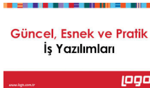
Logo KOBİ ve ERP Çözümleri

1 Mayıs Emek ve Dayanışma Günü kutlama gerekçesiyle yasa dışı eylemleri belirlenen 203 kişi gözaltına alınmıştır. Yaşanan olaylarda 6 emniyet mensubu ve 18 gösterici yaralanmıştır."