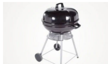
Kömürlü Mangalda İndirim!