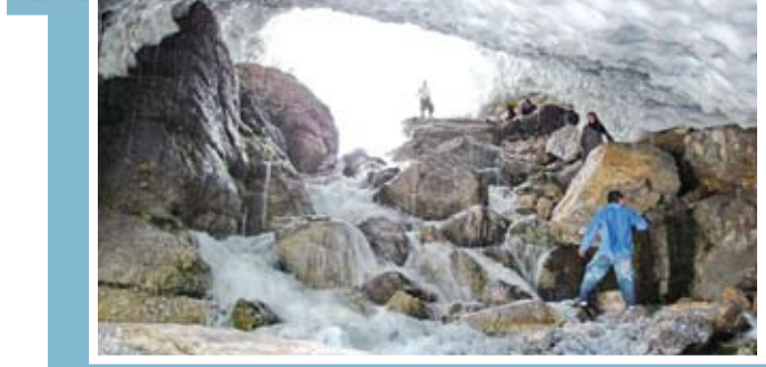
تونل برفی اشترانکوه یکی از زیباترین مناظر طبیعی است که هر بیننده ای را شگفت زده می کند.