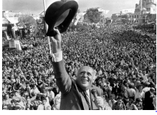
Süleyman Demirel kimdir