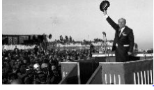
Türk siyasetinin unutulmaz ismiydi