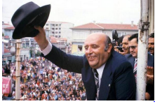
Hürriyet arşivinden çok özel fotoğraflarla Süleyman Demirel

1962-1964 yılları arasında serbest müşavir-mühendis olarak çalıştı. Aynı yıllarda Orta Doğu Teknik Üniversitesi'nde su mühendisliği konusunda dersler verdi.