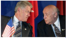
DÜNYA VEFATINI BÖYLE GÖRDÜ

1962-1964 yılları arasında serbest müşavir-mühendis olarak çalıştı. Aynı yıllarda Orta Doğu Teknik Üniversitesi'nde su mühendisliği konusunda dersler verdi.