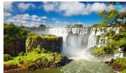
Güney Amerika Turu