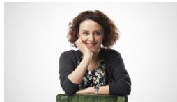
Ayda 3500TL Kazanıyorum