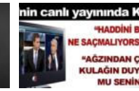
NTV'nin canlı yayınında kavga