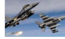
Başbakanlık'dan hava operasyonu açıklaması var