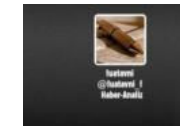
Fuat Avni'den Suruç, Diyarbakır ve Kilis...