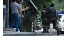
5 bin polisle şafak operasyonu: Gözaltılar var