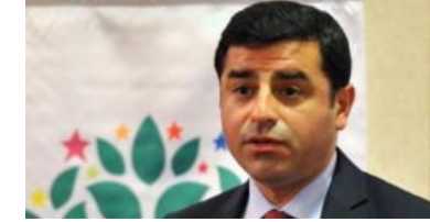
Kandil'den Demirtaş'a sert çıkış