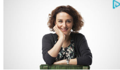
Ayda 3500TL Kazanıyorum