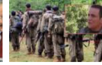
Kandil'den sürpriz çıkış: 'Zor değil...