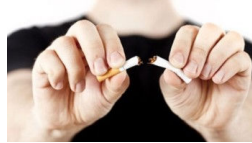
Sigara ile Vedalaşın