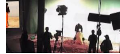
Müthiş iddia... Kafa kesme görüntüleri 'greenbox' mı?