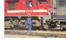
TCDD personeline ateş açıldı: 1 ölü