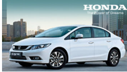
Honda Civic Sedan

Cumhurbaşkanı Erdoğan, "Bugün, NATO'nun olağanüstü bu konuyu muhtevi toplantısı var. Burada da NATO üzerine düşen neyse bu adımı atmaya hazır olduğunu beyan edeceğine inanıyorum" dedi.