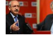
9 vekilin fezlekesi Meclis'te