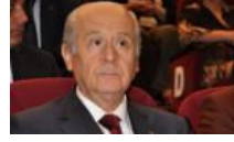
Bahçeli'den sürpriz koalisyon açıklaması