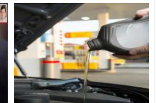
Shell, BMW tarafından tavsiye edilen motor yağı tedarikçisi oldu